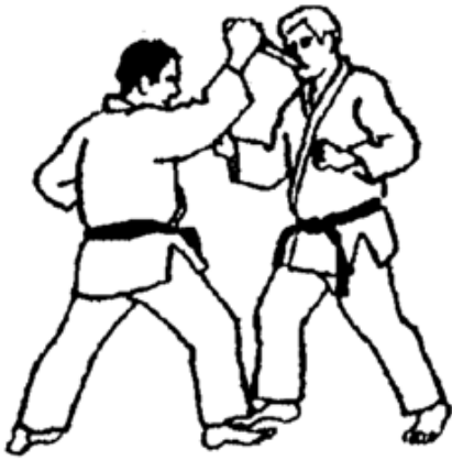
Série D - Attaque 1 - Naname Tsuki