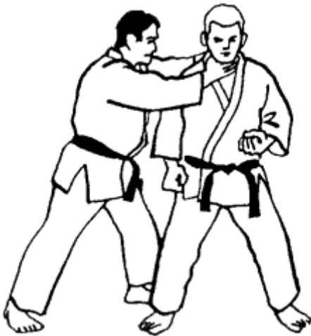
Série A - Attaque 4 - Yoko Dori Kubi