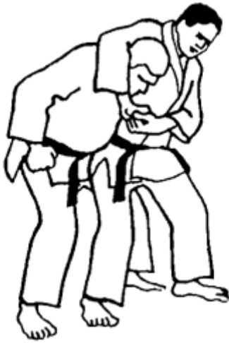
Série B - Attaque 3 - Yoko Dori