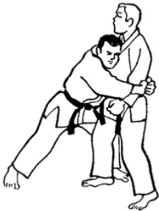
Série B - Attaque 2 - Yoko Dori