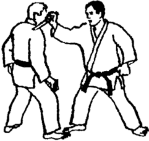
Série D - Attaque 3 - Naname Uchi