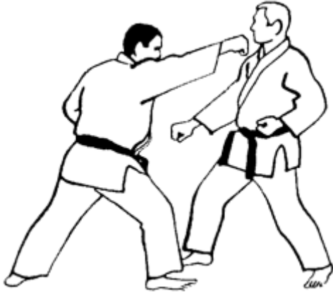
Série C - Attaque 1 - Oi Tsuki Jodan