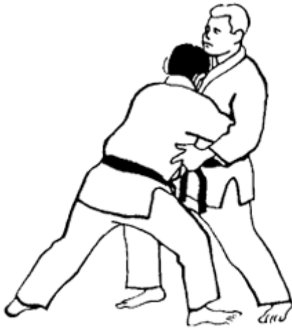
Série B - Attaque 1 - Mae Dori