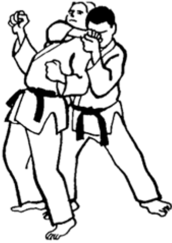
Série B - Attaque 5 - Haddaka Jime