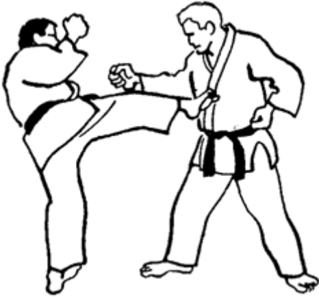
Série C - Attaque 5 - Mawashi Geri Shudan