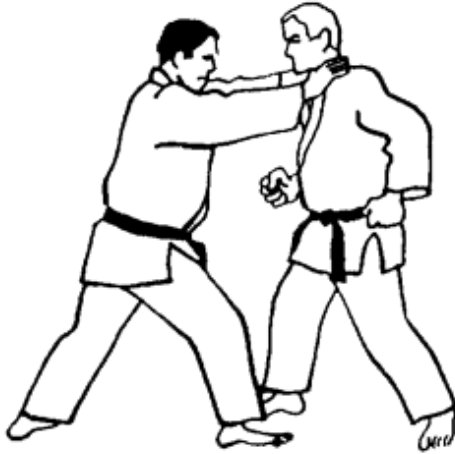
Série A - Attaque 3 - Mae Dori Kubi