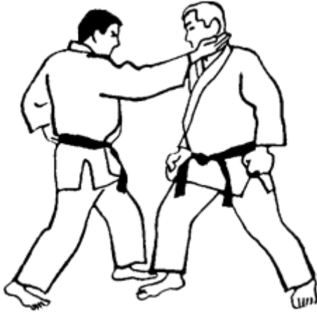
Série C - Attaque 3 - Naname Shuto Jodan