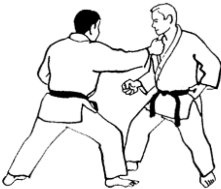
Série A - Attaque 2 - Eri Dori