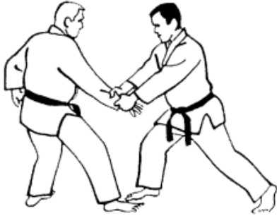
Série A - Attaque 1 - Katate Dori