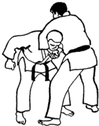
Série B - Attaque 4 - Mae Dori