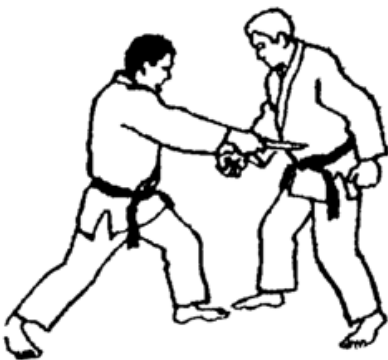
Série D - Attaque 2 - Shudan Tsukkomi