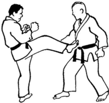
Série C - Attaque 4 - Mae Geri Kekomi Shudan