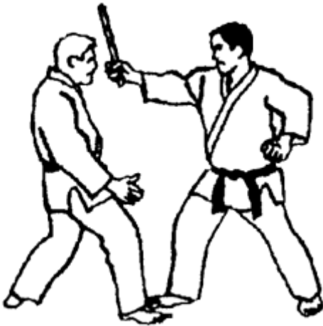
Série D - Attaque 4 - Kiri Komi