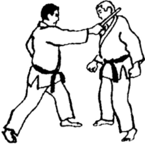
Série D - Attaque 5 - Yoko Uchi